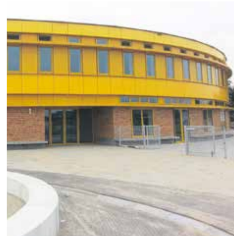
Gevelbekleding Brede school Didam

Beilerstraat 3 7933 TS Pesse 088 773 93 60 info@dakgevel.com www.dakgevel.com