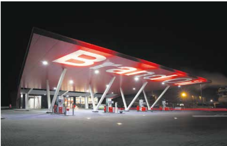
Plafond- en gevelbekleding tankstation Zutphen