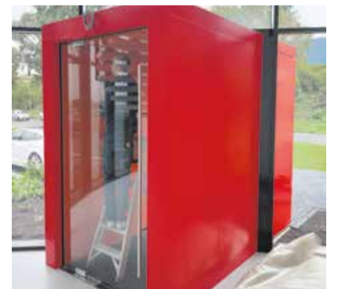
Entree kantoorpand Almelo

MZD levert zetwerk, zoals staal, aluminium en RVS in diverse kleuren, maten en toepassingen. MZD levert zetwerk aan aannemers en particulieren.