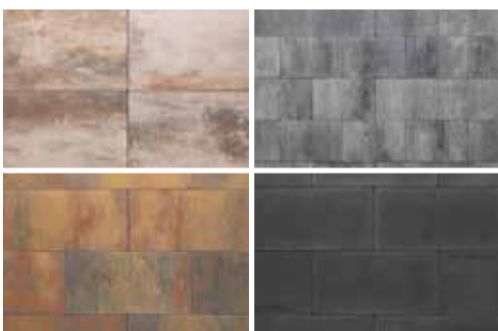
PromoStone bestrating Leverbaar in 4 kleuren

De mooiste showtuin van het Noorden is voor u de tastbare catalogus van alles wat er op het gebied van bestratingen en verhardingen wordt geboden. Zwaagstra Sierbestrating nodigt u uit om snel een wandeling te maken langs het grootse assortiment. De koffie staat altijd klaar!