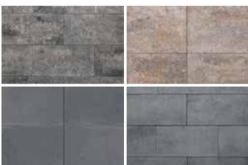
Smartton Geïmpregneerd Leverbaar in 4 kleuren

U vindt meer dan 250 soorten keramische terrastegels in onze showtuin!